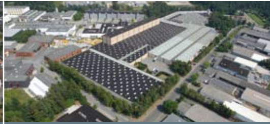
Werk I in Hövelhof