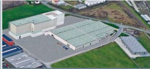
Werk II in Hövelhof

heroal hat den ausgeschäumten Rolladen erfunden und zählt seit über 40 Jahren zu den führenden Aluminium-Profilsystemherstellern, anfangs nur von Rolladen und Rollläden, seit vielen Jahren jedoch auch in den Bereichen Fenster, Türen, Fassaden, Sonnen- und Insektenschutz sowie Photovoltaik.