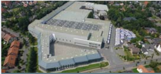
Werk in Verl